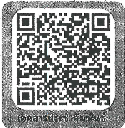
เอกสารประชาสัมพันธ์

องค์กรปกครองส่วนท้องถิ่นที่สนใจสมัคร สามารถขอ User และ Password ได้ที่สำนักงานสาธารณสุขจังหวัด หรือ ศูนย์อนามัย