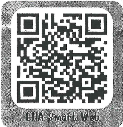
EHA Smart Web

สมัครเข้ารับการประเมินได้ที่ EHA Smart Web